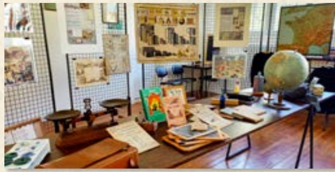
Certificat expo

Atelier - Dictée intergénérationnelle et verre de l'amitié 16H30 : Une dictée intergénérationnelle sur les bancs de l'école suivie d'un verre de l'amitié est proposée pour permettre les échanges intergénérationnels entre les plus jeunes et les anciens qui ont parfois fréquenté les mêmes lieux. École primaire. 2h. Intergénérationnel.