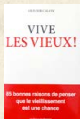
Vive les vieux