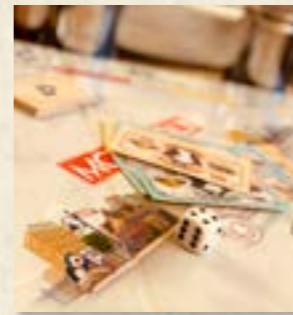
Jeux Monopoly

9H30 : À travers des jeux coopératifs, les joueurs exploreront toutes les facettes de la mémoire, des souvenirs d'enfance à la commémoration de l'histoire, en passant par l'habileté à mémoriser. L'essentiel est de partager ses ressources, ses