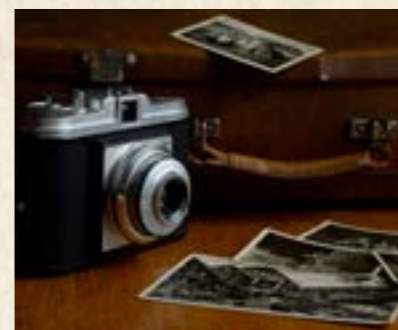
Voyage dans le temps

En partenariat avec le CCAS de Porcellette Cette exposition de photos et d'objets anciens invite les participants à découvrir et revivre des époques passées. Ce voyage dans le temps favorise le partage d'histoires personnelles et collectives, renforçant les liens sociaux et la mémoire culturelle.