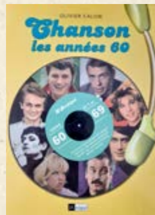
Chansons