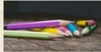
Atelier d'écriture

9H : Les participants s'amuseront avec les mots et partageront leurs souvenirs individuels ou collectifs à travers des lectures à voix haute et des temps d'écriture créative. Bibliothèque. 3h. Seniors et intergénérationnel. Sur inscription.